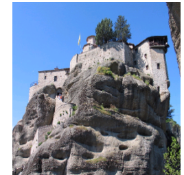
Meteoraklöster bei Kabala